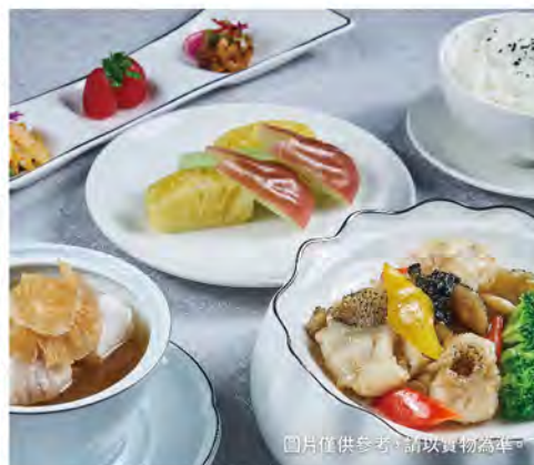
圖片僅供參考，請以實物為準。