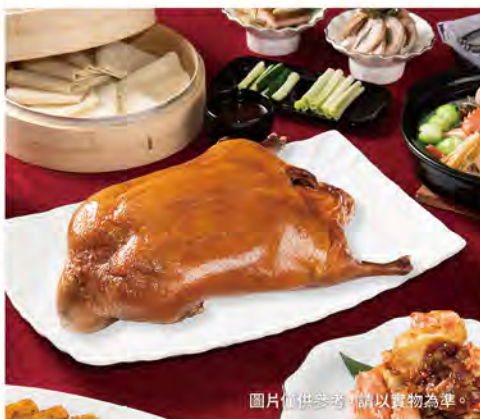
圖片僅供參考，請以實物為準。