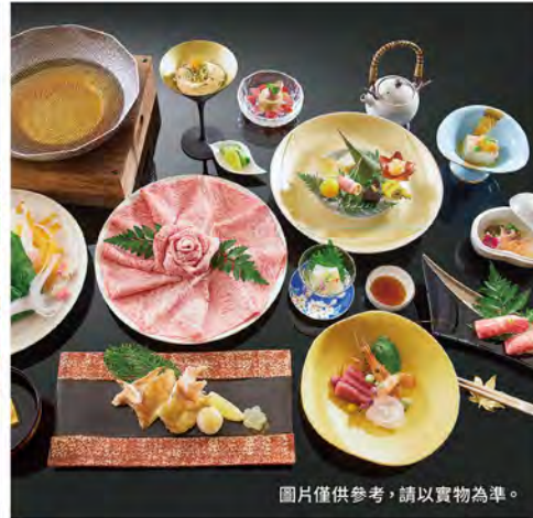
圖片僅供參考，請以實物為準。