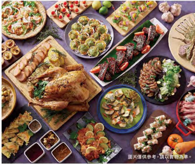
圖片僅供參考，請以實物為準。