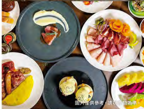
圖片僅供參考，請以實物為準。