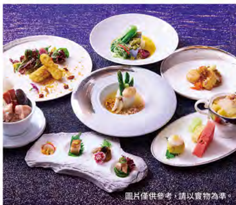
圖片僅供參考，請以實物為準。