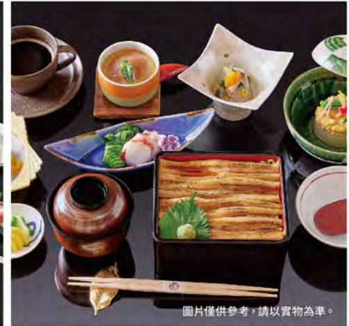
圖片僅供參考，請以實物為準。

81折 旅展價 季節懷石雙人午餐套餐 NT$ 4,400 (原價 NT$5,456)