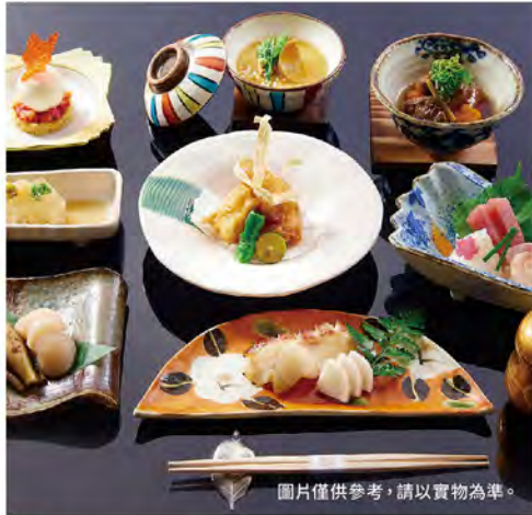
圖片僅供參考，請以實物為準。