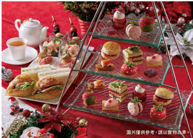
圖片僅供參考，請以實物為準。