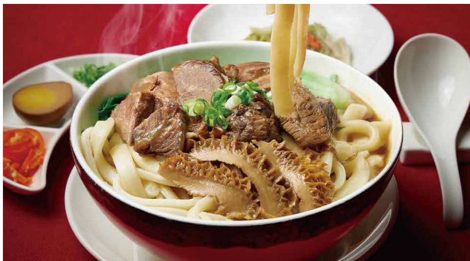
紅燒牛肉麵 牛肉麵 Braised Beef Noodle Soup