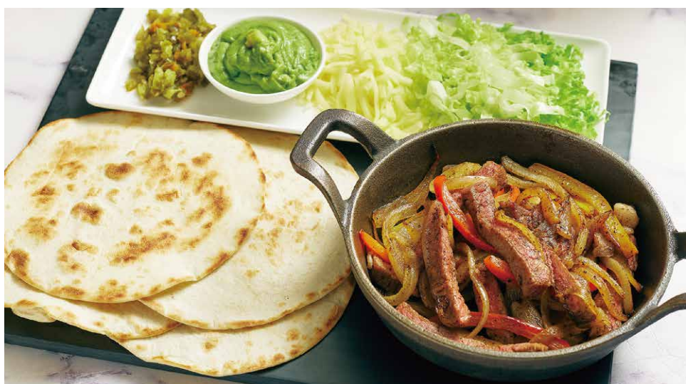
爐烤牛肉法西達佐酪梨醬 アボカドソースのビーフファヒータ Beef Fajitas with Avocado Sauce