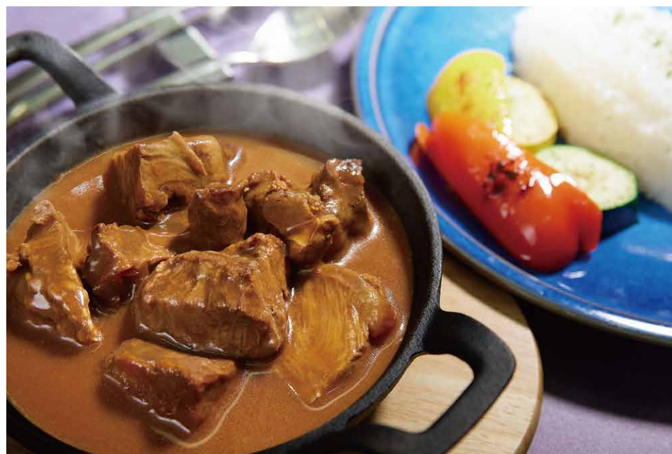
紅酒燉和牛 和牛のビーフシチュー Wagyu Beef Stew