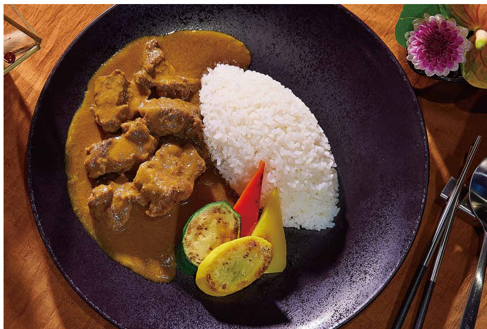
和牛咖喱 和牛カレー Wagyu Beef Curry